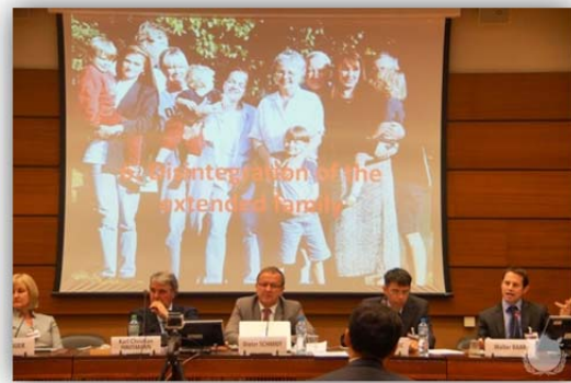
Anna ZABORSKA , Member EU Parliament, Slovakia