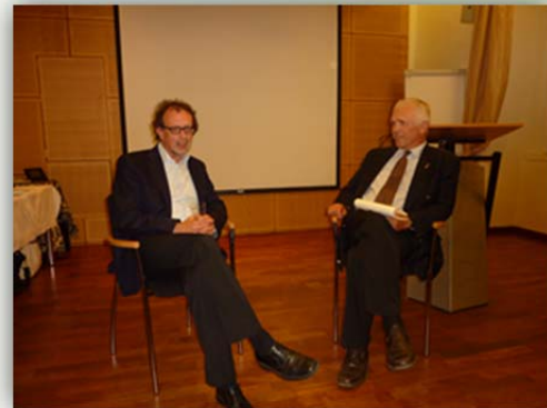
Zentrum für Friedensforschung

The goal of education is according to today's understanding a positive socialization. Is it even possible for people to fit into a conflict laden society? On this evening we want to research the question: is non-violent conflict resolution sufficient or do we need to prepare the path for a culture of communication and relationships?