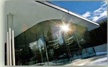
Congresspark Igls 18 th October 2008